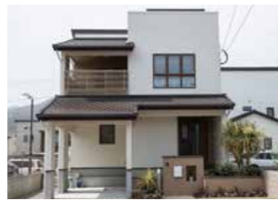
九大学研都市駅より徒歩10分 (写真は同モデルハウス)

家全体が空気清浄機のような役割をしてくれる炭の家仕様の学研モデルハウス。ハウスコンシェルジュが常駐しており、デザインや標準設備などの質問に答えてくれる。普段は営業スタッフもいないから勧誘の心配なく見学できるのも嬉しい。