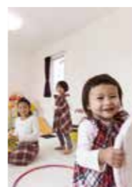
元気に遊ぶ子ども達