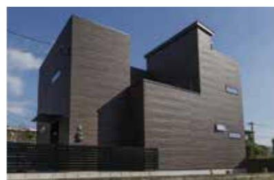
自然豊かな糸島LIFE。スタイリッシュな外観のT邸