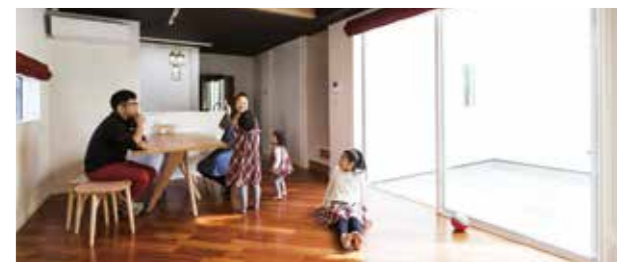
中庭からの光が明るく開放感のあるLDK。これなら周囲からの視線も気にならない