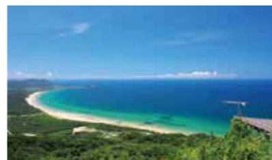
足を延ばすと美しいビーチと自然。人気スポット糸島

自然豊かでどこか懐かしい暮らしの面影が残る糸島。福岡市の中心から電車で数十分という便利さと程よい自然がこの街の魅力だ。糸島事情に精通した同社でなら土地探しから完成後の暮らし方までサポートしてくれる。