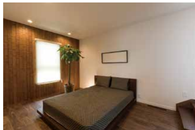
リゾートテイストを取り入れた主寝室。大容量のウォークインクローゼットも完備

近頃発展目覚ましい糸島エリアでの家づくりを考える人にすっかりお馴染みの「へいせいの木の家」。無垢の床（燻煙杉）やシラス壁等、様々な自然素材をたっぷり使い、自然を感じながら過ごせる流行に左右されないリラクゼーションスタイルを提案している。今年4月に完成したばかりの学研モデルハウスは、家全体が空気清浄機のような役割をしてくれる炭の家仕様のモデルハウス。家の床下と天井の中に取付けた約1tの炭の力で空気を浄化、クリーンな室内を体感できる。また、子ども達が成長しても程よい距離でお互いの存在を感じられるLDKやスキップフロアの工夫、地下に備えたシアタールームやインナーバルコニーの上質感も見てほしい。普段は営業スタッフもいないから、勧誘などを一切気にせず自由に見学できるのも◎。詳細や施工例はHPでも確認できる。