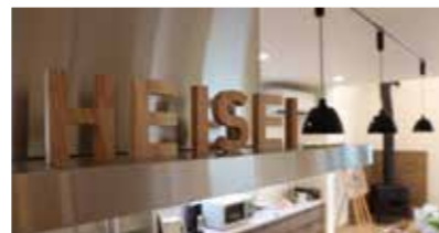
緊急時には60分以内に駆けつける、スピーディな対応

創業から70年地域に根ざし「顔が見える距離のお付き合いを大切に」をモットーに地元企業、自治会との交流も盛んな同社。地域との密接なパイプがあり独自のルートで土地情報が集まる。